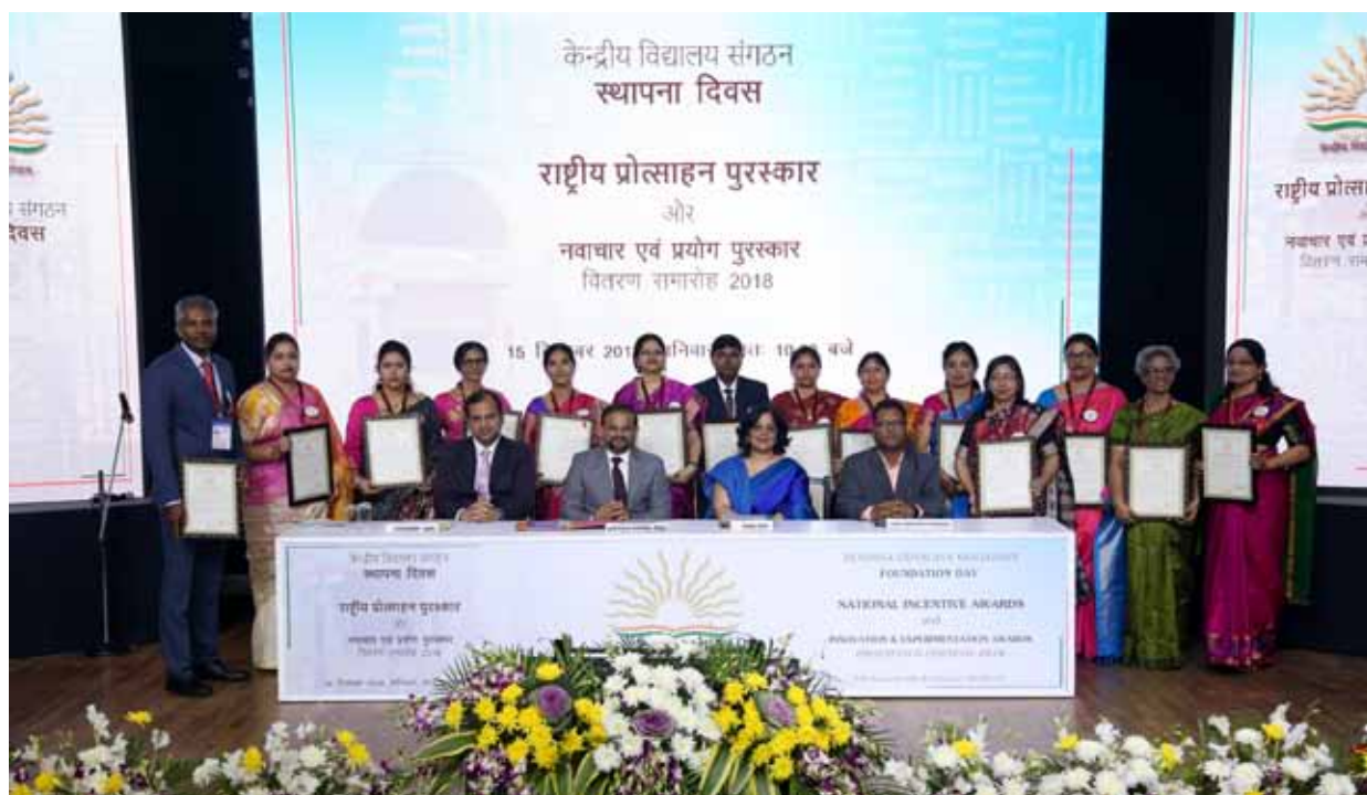
नई दिल्ली में आयोजित स्थापना दिवस समारोह में नवाचार तथा प्रयोग पुरस्कार-2018 के विजेताओं का समूह

The teachers presented the innovation projects before the Selection Committee and the Committee after evaluation, discussion and examination of the proposals, recommended following 05 entries of Primary Teachers and 06 entries of Secondary and Senior Secondary Teachers of Kendriya Vidyalayas for Innovation and Experimentations Awards 2018-19.