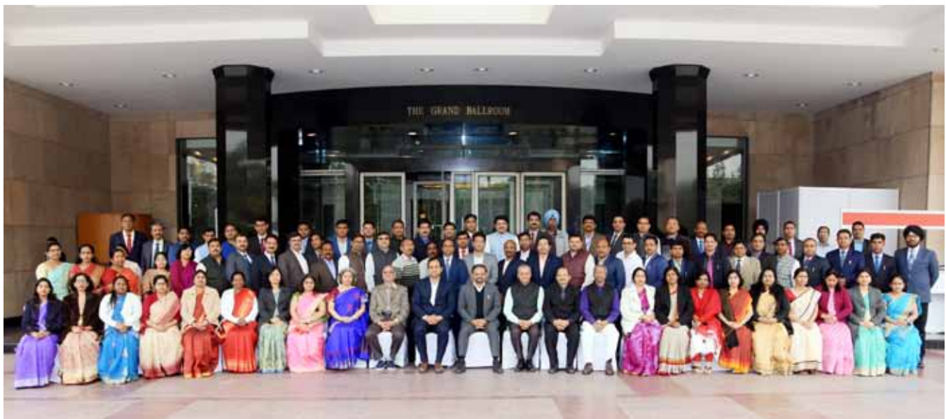
केन्द्रीय विद्यालय संगठन के शीर्ष अधिकारियों के साथ प्राचार्यों के लिए आयोजित प्रवेश प्रशिक्षण पाठ्यक्रम के प्रतिभागियों का समूह Group Picture of participants of Principal's Induction Course with Top Officers of KVS