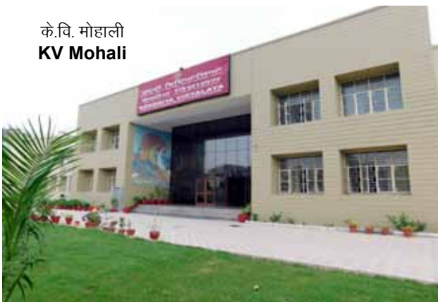
के.वि. मोहाली KV Mohali