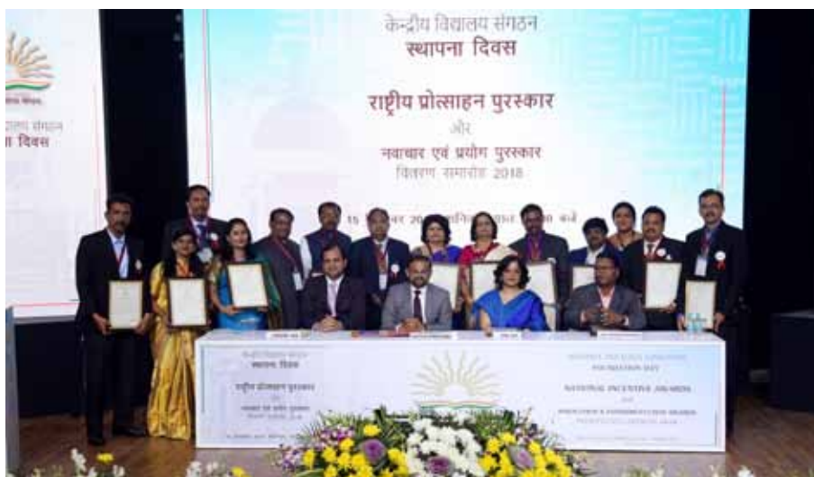
नई दिल्ली में आयोजित स्थापना दिवस समारोह में के.वि.सं. राष्ट्रीय प्रोत्साहन पुरस्कार-2018 के विजेताओं का समूह Winners of KVS National Incentive Awards-2018 at the Foundation Day Ceremony organized in New Delhi

KVS has made major changes in KVS Incentive Award Scheme in 2018. KVS has adopted online system for inviting nominations from teaching and non-teaching employees for KVS Incentive Awards in 2018. The number of National Incentive Awards has been reduced from 80 to 30 and also enhanced the prize money of Award from Rs. 10,000 to Rs. 20,000. Also, selection of awardee done by Independent Jury headed by the eminent educationist.