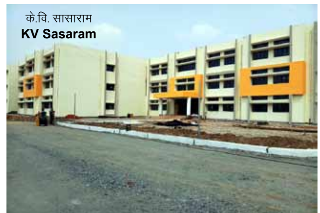
के.वि. सासाराम KV Sasaram