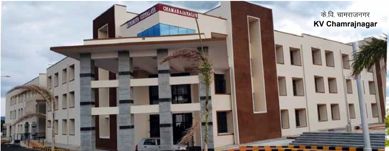
के.वि. चामराजनगर KV Chamrajnagar