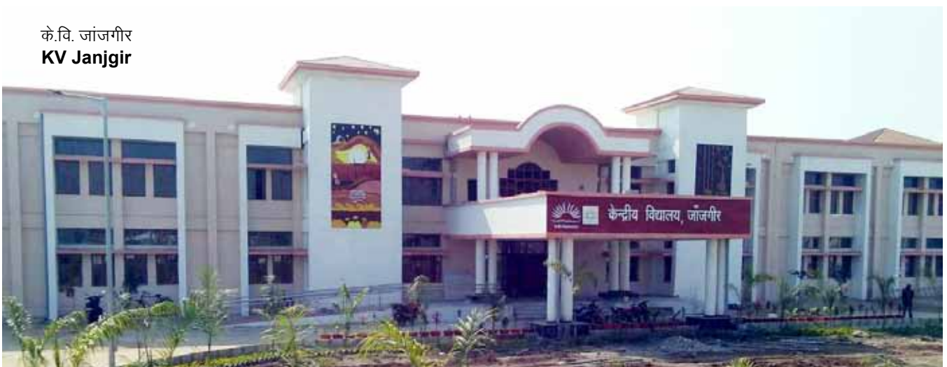
के.वि. जांजगीर KV Janjgir