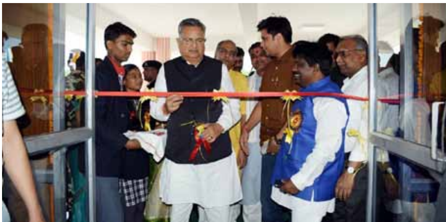
छत्तीसगढ़ के माननीय मुख्यमंत्री डॉ. रमन सिंह द्वारा केन्द्रीय विद्यालय राजनांदगांव के नवनिर्मित भवन का उद्घाटन किया गया।