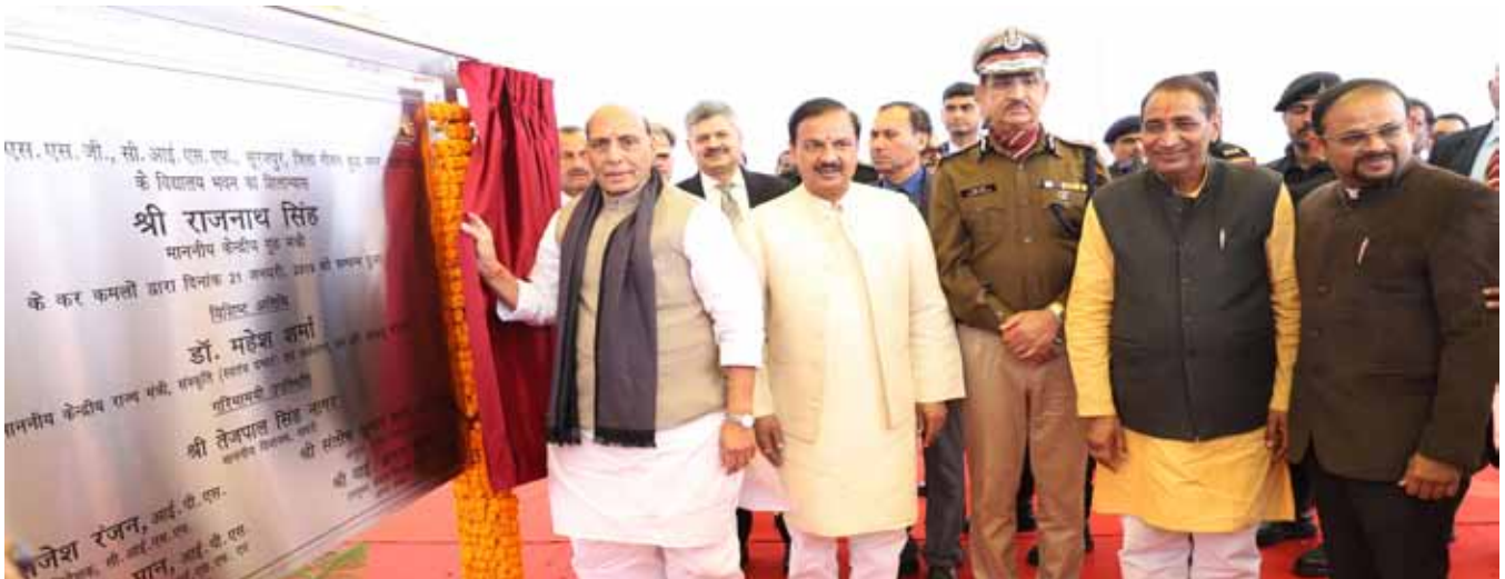
केंद्रीय गृह मंत्री श्री राजनाथ सिंह द्वारा केन्द्रीय विद्यालय एसएसजी, सीआईएसएफ, गौतमबुद्धनगर के विद्यालय भवन का शिलान्यास किया गया Union Home Minister Shri Rajnath Singh laid foundation stone of New Building of KV SSG, CISF, Gautambudhnagar.